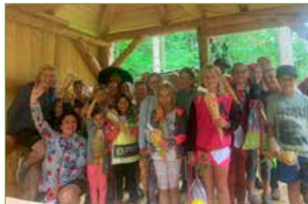
Nur Sieger beim Walchentriathlon der Frauenbewegung

Auch die Minitrucker hängten einen zweiten Termin an, und somit