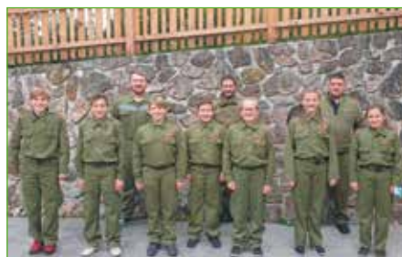
Erfolgreicher Wissenstest für die Niederöblarner Feuerwehrjugend

Für sieben Jugendliche und einen Quereinsteiger war es im Oktober noch möglich, am Wissenstest in Rottenmann teilzunehmen und