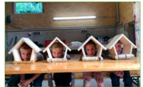
Mit der Landjugend eigenhändig Vogelhäuschen gebaut

Leider konnte der geplante Herbstferien-Wandertag wegen der Corona-Maßnahmen nicht stattfinden. Hoffentlich kann er nachgeholt werden.