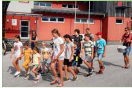
Abmarsch mit Trommelwirbel vom Musikverein