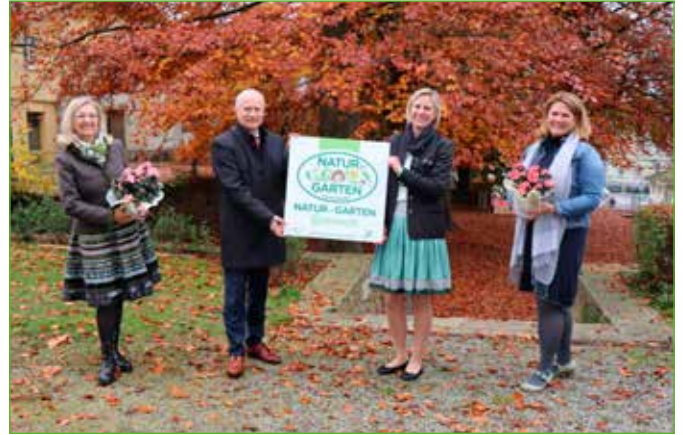
Öblarn zählt zu den Vorreitern bei „Natur im Garten“.

Die Gemeinde würde sich sehr freuen, wenn auch viele Privatgärten dem Ziel von Natur im Garten folgen würden. Wenn man durch das Gemeindegebiet spaziert, entdeckt man schon das eine oder andere „Natur im Garten“-Schild.