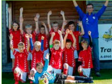
Erfolgreiche U10 des FSV Öblarn