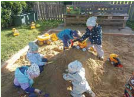
Wenn es im Herbst kühler wird, kann mit guter Bekleidung noch lange die Sandkiste gestürmt werden.