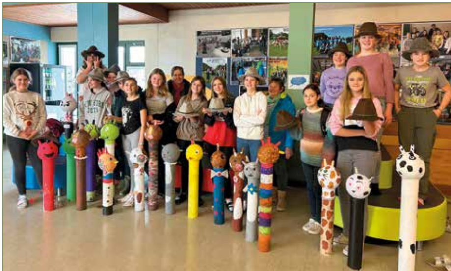
Kunstwerke der Mädchen der 3. Klassen der MS Stein

Unter der professionellen Anleitung von Frau Christl Schmiedhofer aus Bach tauchten sie in die Feinheiten des Filzens ein und zauberten erstaunliche Hutkreationen. Von der Auswahl der Wolle bis zur Gestaltung ihrer Hüte durchliefen die Schülerinnen und Schüler jeden Schritt des Prozesses mit Begeisterung. Parallel dazu wagten sich die Schülerinnen und Schüler in das aufregende Abenteuer von Pappmaché-Figuren. Mit Gummihandschuhen, Pappmaché und einfachen Materialien ausgestattet, gestalteten sie faszinierende Kunstwerke. Von gruseligen