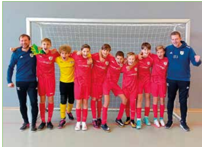
Die U15-Mannschaft gewinnt den Futsal-Cup in Bad Mitterndorf