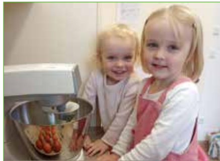
Sogar erste Grundfertigkeiten der Küchenarbeit werden in der Kinderkrippe etwa beim Backen vermittelt.