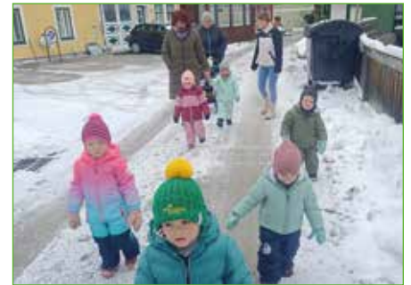
Spaziergänge sind mit den kurzen Beinen ganz schön anstrengend, machen im ersten Schnee aber Spaß.