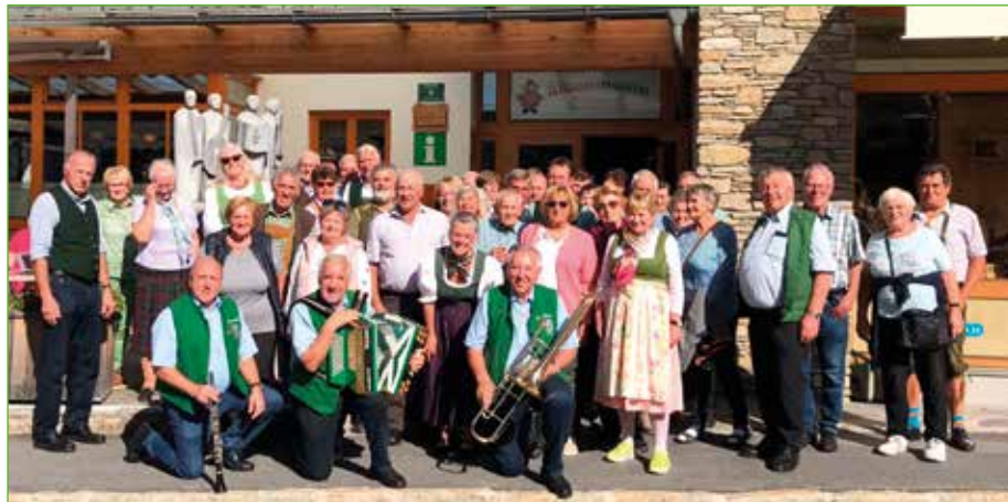
Die große Gruppe aus Öblarn zu Besuch beim „Stoakogler-Trio“

Den Höhepunkt im reiseffreudigen Herbst bildete für 50 Mitglieder eine Fahrt über Passail und die Teichalm nach Gasen. Nach dem Mittagessen spielte vor dem Stoanihaus das „Original Stoakogler-Trio“ wie in alten Zeiten zünftig auf. Die lustigen Moderationen und die bekannten Hits versetzten die Reisenden aus Öblarn auf Anhieb in beste Stimmung. Die drei Spitzenmusikanten nahmen sich ausreichend