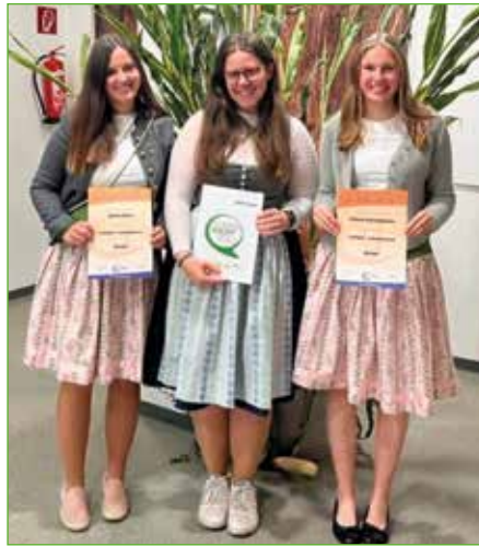
Drei junge Damen der Öblarner Landjugend erhielten ehrenvolle Auszeichnungen überreicht.

te. Nach dem Festgottesdienst servierte die Landjugend im ÖHA beim Frühshoppen mit großer Freude frische Krapfen, selbstgemachte Mehlspeisen und Getränke.