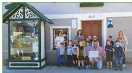
Kindergartenkinder besuchten Bürgermeister Franz Zach und überreichten ein selbstgemaltes Bild.