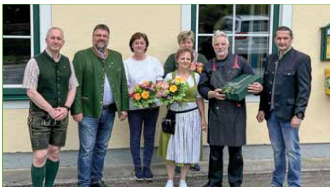
Am 10. Mai stellten sich zahlreiche Gratulanten bei den neuen Wirtsleuten in Niederöblarn ein.

Mit großer Freude konnte man in Niederöblarn und Öblarn die Nachricht vernehmen, dass der „Stecher“ wieder offen hat.