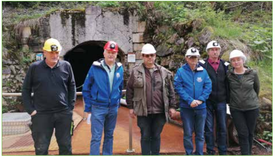
Jährlich müssen die Begleitpersonen für die touristischen Führungen im Schaubergwerk sicherheitstechnisch geschult werden.

In den darauffolgenden Jahren wurde unter Obmann Günther Dembski enorm viel für die Revitalisierung der Stollen und Schmelzanlagen geleistet und der Touris-