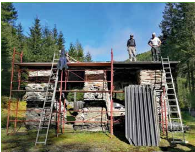
Der historische Kupferschmelzofen wurde vom Bergbauverein mit neuem Dach versehen.