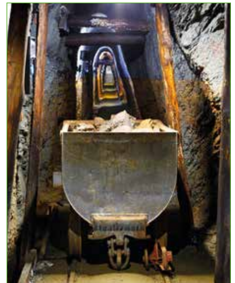
Das Hauptaugenmerk legt der Bergbauverein auf die Erhaltung des Schaubergwerkes „Thadäusstollen“.

Führungen auf dem „Öblarner Kupferweg“ können für Gruppen ab 15 Personen gebucht werden und sind auch in Kombination mit dem „Wassererlebnis Öblarn“ möglich.