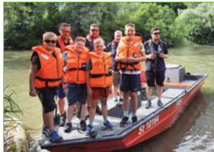
„Helden von morgen“ mit dem Rettungsboot der FF Niederöblarn