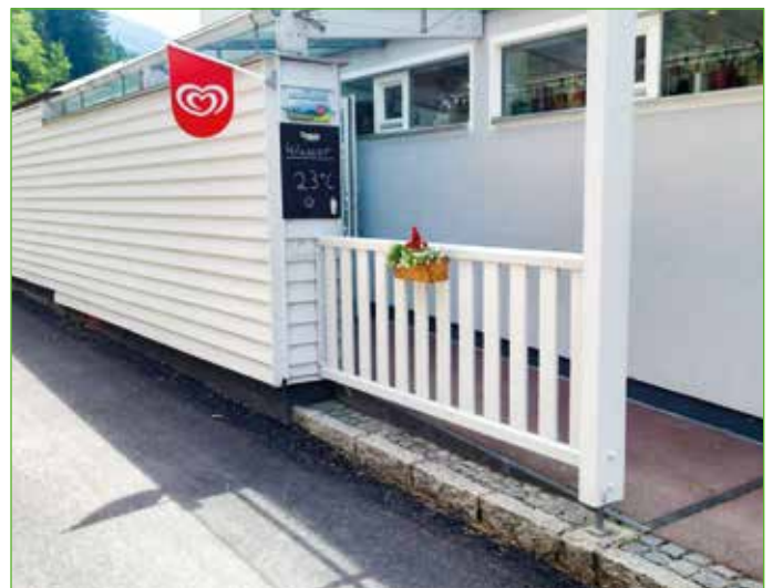
Ein Begrenzungsgitter beim Schwimmbad-Ausgang schützt Kinder vor Gefahren der Straße.