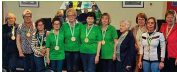
Die erfolgreiche Damemannschaft aus Öblarn bei den Bezirksmeisterschaften im Kegeln.

Bitte Termin vormerken: Bezirkswandertag am 6. September in Irnding.