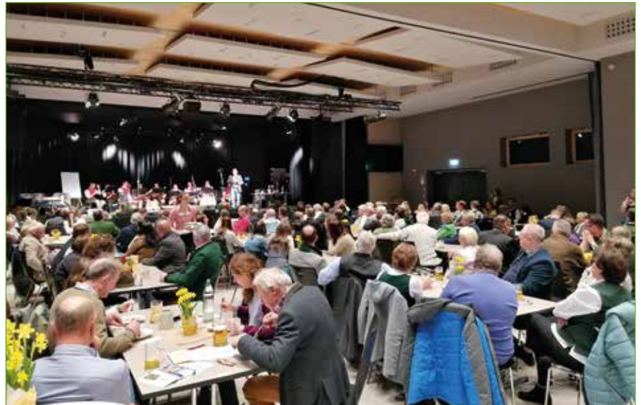
Bei der großen Auftaktveranstaltung im ÖHA wurden die teilnehmenden Musikanten vorgestellt.

Dämmerschoppen mit „Holzblecherisch“ beim Gasthof zum Grimmingtor in Niederöblarn. Wir wünschen der Veranstaltungsreihe weiterhin viel Erfolg!