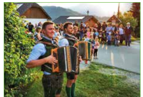
Ausgezeichnete Stimmung beim Maibaumumschneiden der FF Niederöblarn