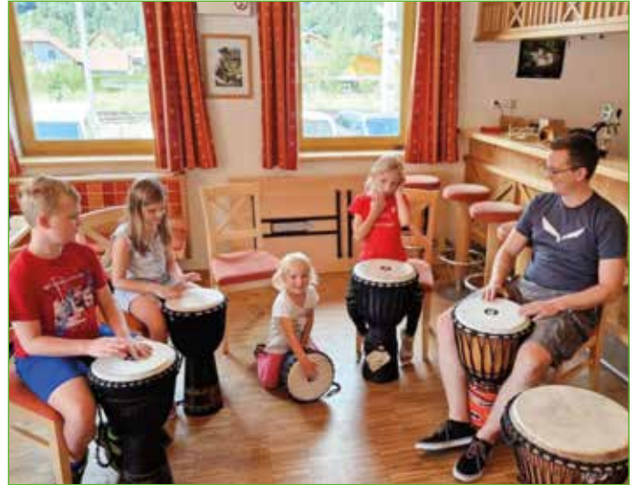
Im Rahmen der Feriengaudi konnten die Kinder beim Musikverein Instrumente kennenlernen.