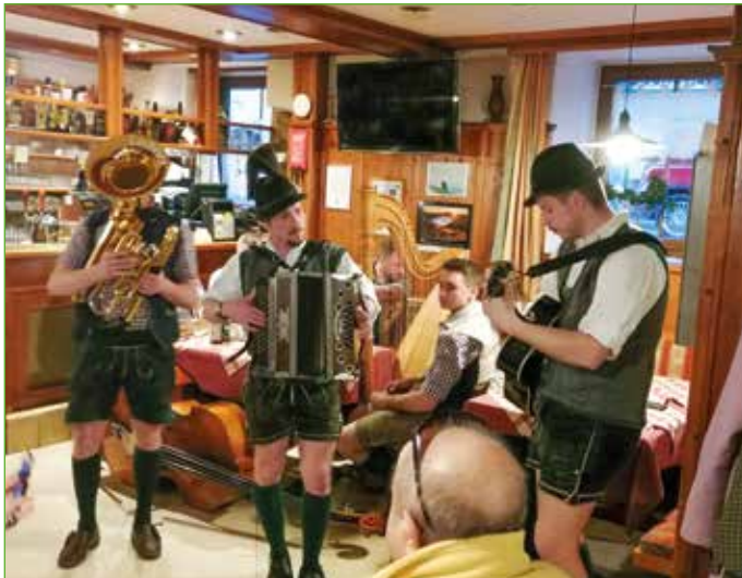
Beste Stimmung und Unterhaltung bot am 21. April das „Musikantenroulette“ beim Stralzn.