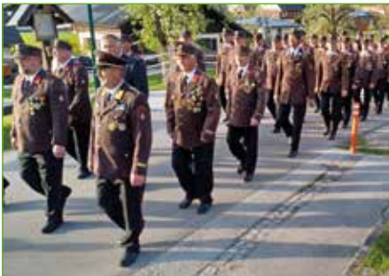
Einmarsch der Feuerwehren zum Florianikirchgang in Niederöblarn

Die FF Niederöblarn wünscht allen Lesern und Leserinnen einen schönen und unfallfreien Sommer.