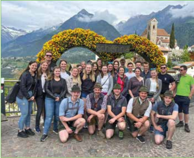
Ein außergewöhnliches Erlebnis war der Landjugendausflug nach Südtirol.

B ei der Landjugend Öblarn war in letzter Zeit wieder einiges los. Vielen darf zu unterschiedlichsten Leistungen herzlich gratuliert werden.