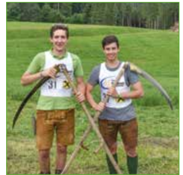
Die Teilnahme am Landesentscheid im Sensenmähen ist Tradition.

Das Highlight des bisherigen Jahres war der Landjugendausflug nach Südtirol. In Schenna stand eine Spargelführung inklusive Weinverkostung in der Kelle- rei Terlan auf dem Programm. Weiter ging es mit einer Betriebsbesichtigung am Laimburg/Latstetterhof. Dort gab es einen Einblick in den Obst- und Weinbau. Danach verbrachten die Jugendlichen aus Öblarn gemütliche Stunden mit der Bauernjugend Schenna. Vor der Heimreise gab es bei der Stadtführung in Meran noch Geschichtskunde über Südtirol. Dieser Aus- flug wird noch lange in Erinnerung bleiben.