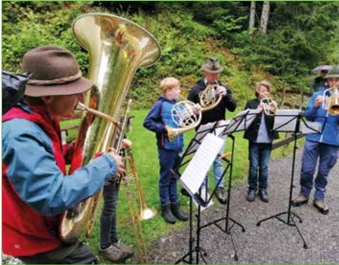
Für Musikantennachwuchs ist gesorgt! Die „Jungen Sonnberger Bläser“ bei der Annatag-Messe.