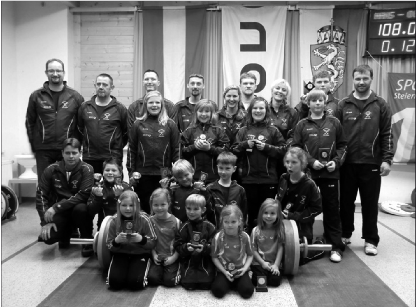
Die erfolgreiche Mannschaft der Gewichtheber des Athletikklub Union Öblarn