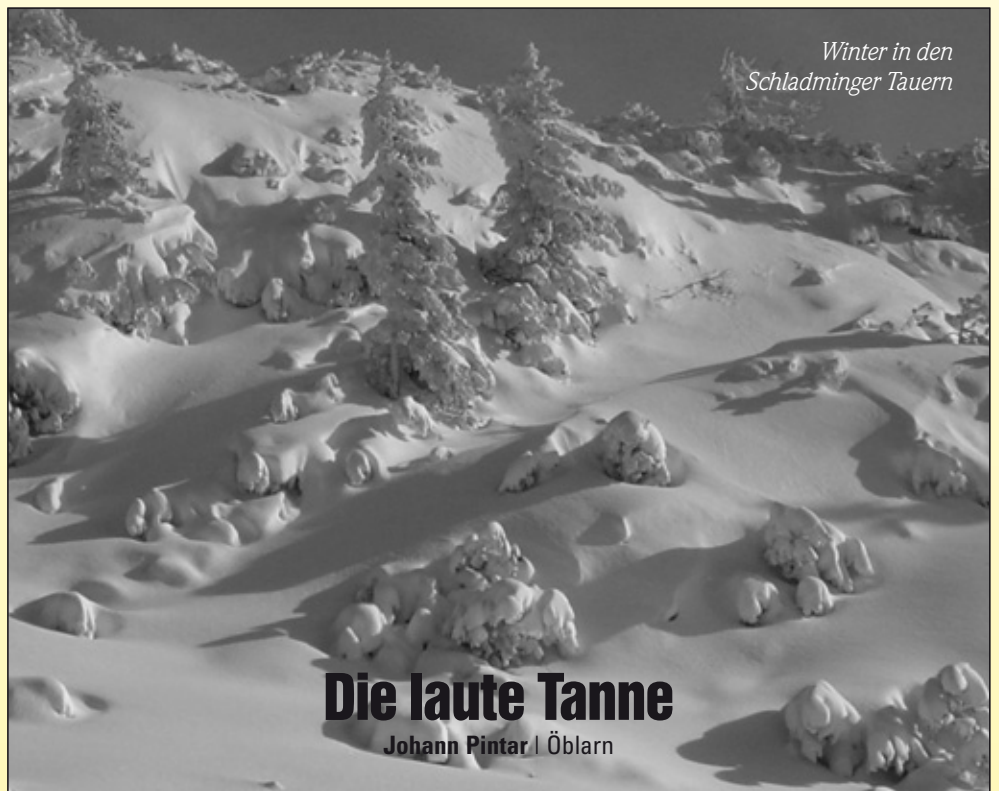
Winter in den Schladminger Tauern

Danke, wenn Sie den beiliegenden Zehlschein verwenden um „Öblarn aktiv“ zu unterstützen, damit wir auch weiterhin über die vielen Aktivitäten in Öblarn berichten können. Wir sind bemüht, eine Ortszeitung für ALLE Öblarner zu gestalten.