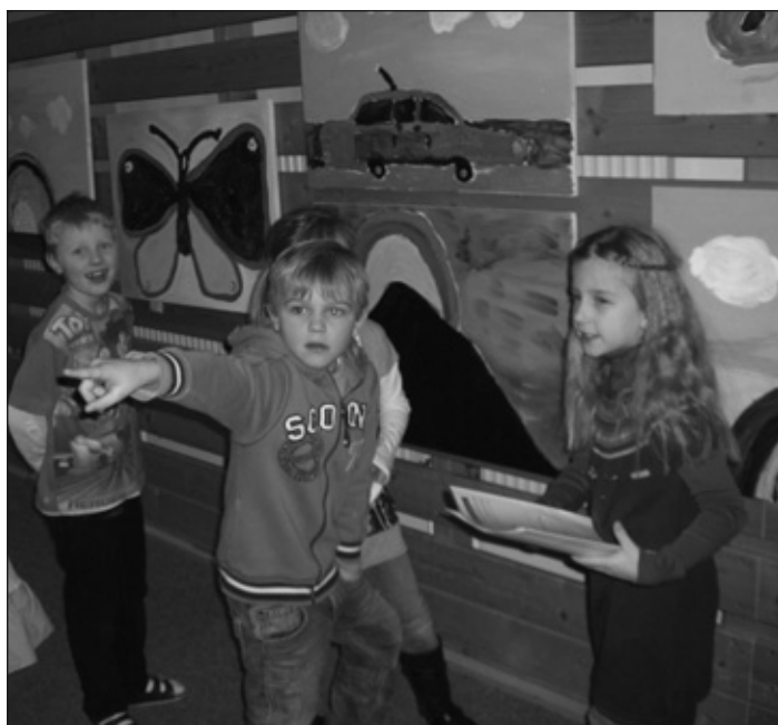
Kinder der Volksschule Öblarn mit ihren Kunstwerken aus dem Malworkshop.

präsentierten die kleinen Künstler ihre Werke im Rahmen einer Vernissage stolz ihren Eltern, die sie gegen eine freiwillige Spende erwerben konnten. In kürzester Zeit waren alle Bilder verkauft und hatten einen Reinerlös von € 400 erbracht. Dieser Betrag geht als Spende an eine Grundschule in Burkina Faso, in der 195 Kinder, die ohne Eltern oder in sehr schwierigen Verhältnissen aufwachsen, eine Chance auf Bildung bekommen. Herzlichen Dank den Schülern und Lehrern für diese tolle Initiative!