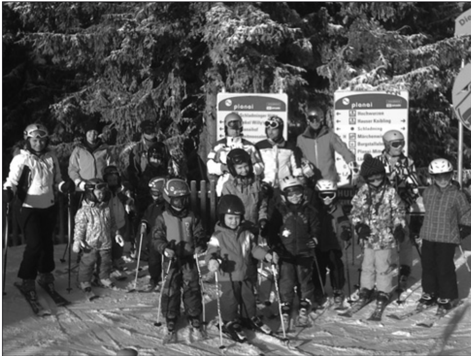
Die Öblarner Pistenflöhe eröffneten den Schiwinter.