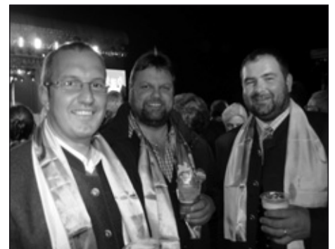
Die Öblarner Volkspartei hat ein tatkräftiges Team und freut sich über die Wahlerfolge 2010.

2010 der ÖVP ihre Stimme gegeben haben und gehen mit dem festen Willen ins Jahr 2011, weiterhin das Beste für Öblarn zu geben.