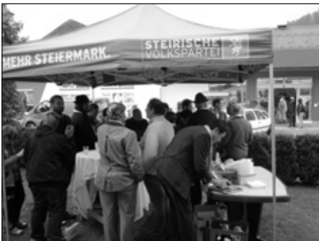
Sehr positive Stimmung herrschte beim Sturmstand der ÖVP am Tag vor der Landtagswahl.

Wir erinnern uns noch an das großartige Wahlergebnis für die ÖVP in Öblarn bei den Gemeinderatswahlen am 21. März 2010.