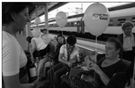
Die Öblarner Frauenbewegung auf großer Fahrt in Wien