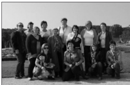
Die Frauen aus Öblarn im Garten des Schlosses Schönbrunn

Haben Sie Wien schon bei Nacht gesehen? 13 reiselustige Öblarnerinnen waren im September begeistert, als sie durchs nächtliche Wien spazierten. Unsere Bundeshauptstadt